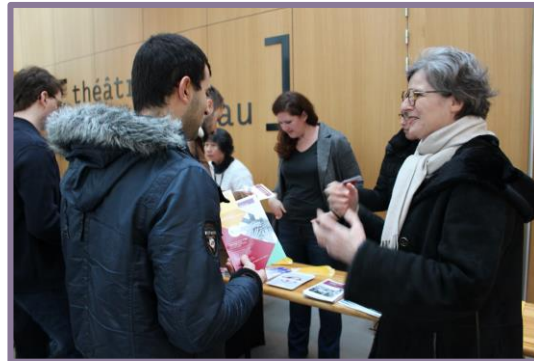
Accueil des doctorants