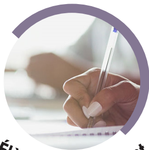
Élève ou Doctorant