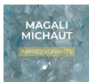
Impressionniste (Autoproduit) 8 titres • 2022