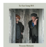
LE LAC LONG 814 Tessons flottants (Comedia) 17 titres • 2021 Obs. : Magali chante et joue du violon sur La moirure du lac.