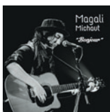
Bonjour (Autoproduit) 4 titres • 2016