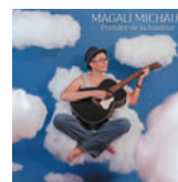
Prendre de la hauteur (Autoproduit) 16 titres • 2026